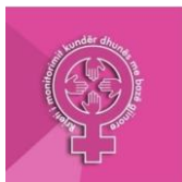
Tabela e Përmbajtjes